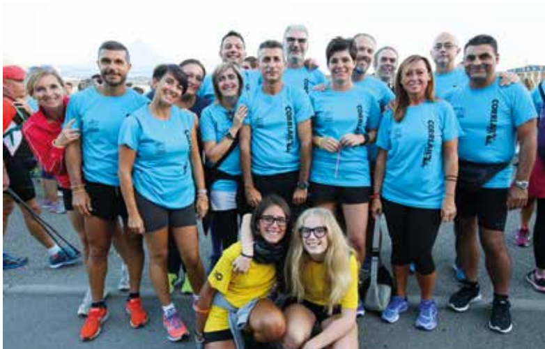
Gruppo volontari AIL di Novi di Modena.